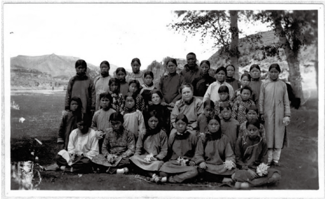
图六：培贞女子学校的中国师生与宣教士合影（1925年左右，岷州） [50]