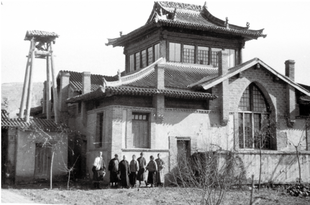
图五：狄道的宣道会教堂（建于1920年） 〔30〕

带领全村的乡亲归主；在城西南九十里的景古（今甘肃省临夏回族自治州康乐县景古镇），一位富有、受人尊重的老奶奶勇敢地为主做见证，直至一间教会被建立起来。在庆坪（今渭源县庆坪镇）、陈家嘴（Cheng-chia-tsui）等多地，起初艰难赢得的灵魂都成为祝福的管道，带领乡邻和亲属离弃偶像崇拜，转向神。 〔31〕