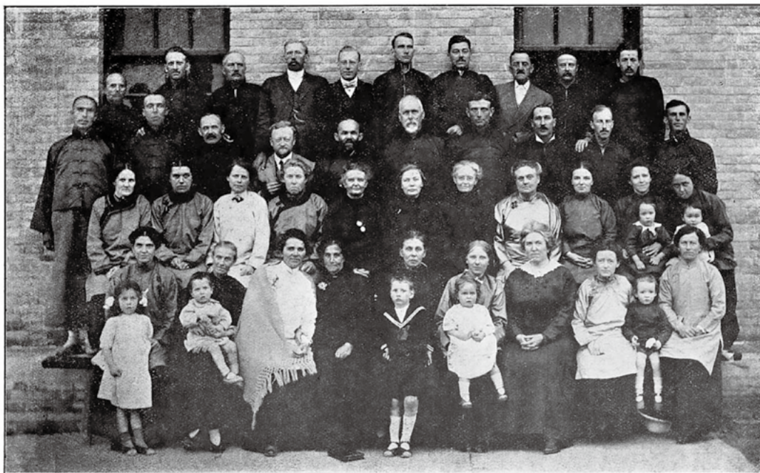
FIRST UNITED CONFERENCE OF PROTESTANT MISSIONARIES IN KANSU.