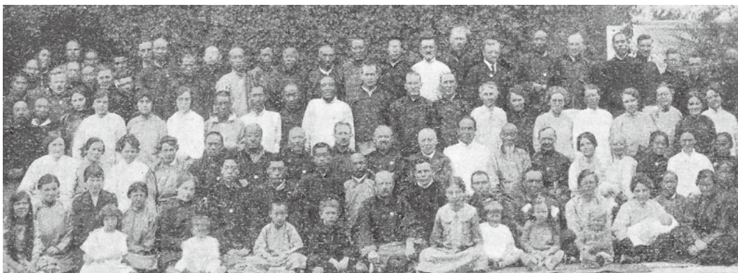
图四：第二届甘肃省宣教士联合会议中西同工合影（1924年8月，狄道） [26]